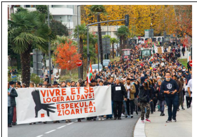
Manifestations d'ampleur chez nos amis du Pays Basque nord. On emboîte le pas en Savoie ?

Dans les Pays de Savoie, plus d'un logement sur quatre est une résidence secondaire ou occasionnelle : comprendre logement touristique, quand dans le département du Rhône on ne dépasse qu'à peine les 3 %. Dans certaines de nos communes, ce taux atteint 90% ! Ceci est le résultat d'années d'abandon politique ou pire de soumission politique face à la manne financière que pouvait représenter le « tout ski ». Les dirigeants de L'État français considèrent la région Savoie comme une carte postale et l'assument parfaitement, dans le mépris de la population locale. Les constructions de ces logements, qui n'apportent de la vie dans nos villages que quatre mois dans l'année, ainsi que les